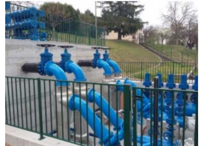
FILTRI DELLA CENTRALE DI PONTON.