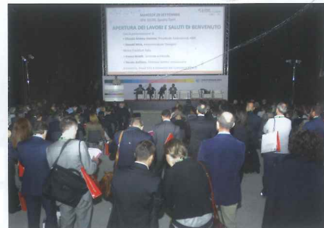
Successo di partecipazione per Telecontrollo 2015

Sul palcoscenico del Forum Telecontrollo abbiamo potuto ascoltare le più innovative soluzioni per la supervisione, il controllo e l'automazione delle reti, delle città e dell'industria seguite da 764 visitatori, un numero che segna un +12% rispetto alla scorsa edizione. Non siamo solo di fronte a una vision tecnologica di ampio respiro ma anche a una realtà applicativa italiana che rappresenta un'eccellenza a livello mondiale.