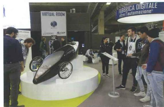
504 visitatori a Forum Meccatronica 2015

dustriale verrà ripercorso attraverso due proposte distinte e al tempo stesso sinergiche. Ad aggiungersi infatti all'Iniziativa speciale Fabbrica Digitale, oltre l'automazione, ci sarà infatti il nuovo Salone Fabbrica Digitale, dedicato alla fase progettuale e ai vari passaggi del processo di controllo dell'informazione dei dati. Un'offerta completa che darà una panoramica a 360 gradi di come l'industria 4.0 possa rendere più efficienti i processi di produzione, sia dal punto di vista della riduzione delle tempistiche e dei costi che da quello della scelta del miglior partner industriale.